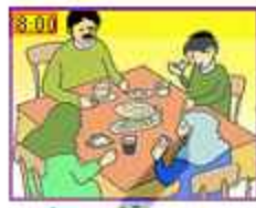
أسرةٌ تجيد يا كِلان القُطُور.