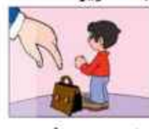
يا ولدي! اِرْزُقِ الحَقِيْبَةَ