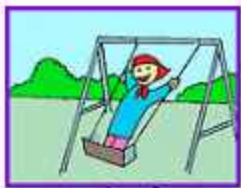
هي حزينة جداً.

۱۷- با توجه به تصاویر داده شده، کدام جمله صحیح است؟